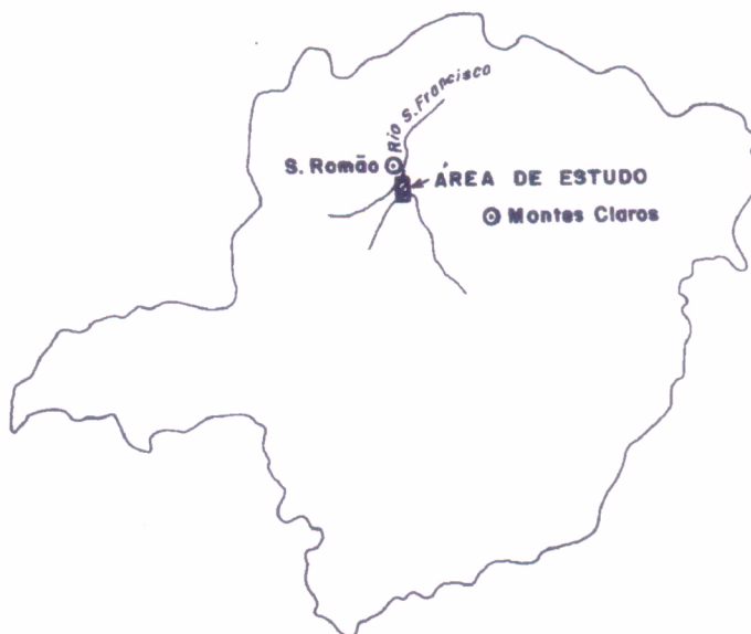
Figura 1. Localização da área de estudo.

Em 1976, o Departamento de Obras Contra a Seca constatou a produção sub-comercial de gás em dois poços perfurados nesse município. Posteriormente, a Petrobrás, incentivada pelas mudanças de enfoque sobre as possibilidades petrolíferas dos estratos pré-cambrianos, intensificou os estudos da bacia do rio São Francisco, que resultaram em várias campanhas de campo e inúmeras descobertas de exsudações superficiais de gás, destacando-se a emissão natural de gás do rio Paracatu, denominada regionalmente de Remanso do Fogo .