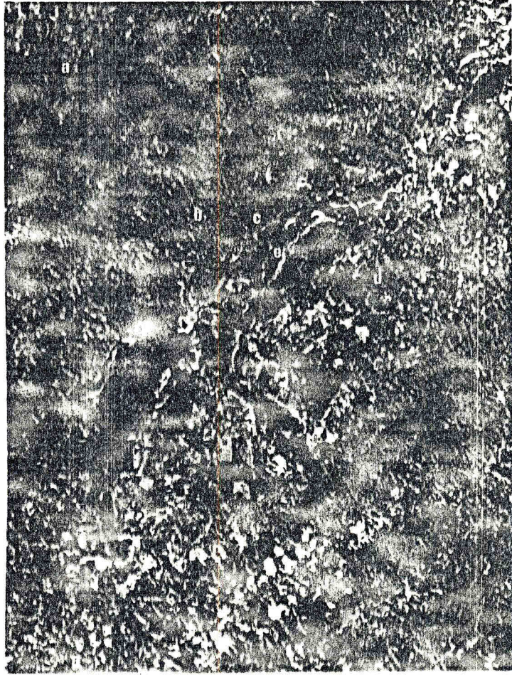
Figura 1 - Imagem TM/LANDSAT do Vale do Paraíba