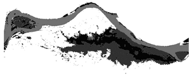
Figura 3 - Separação pluma do Rio Amazonas (área mais escura - preta) através da técnica de segmentação e classificação Bhattacharya. Amazon plume separation (black area) through image segmentation technique and Bhattacharya classification.

A escolha da banda 3 levou em conta o efeito que as partículas inorgânicas em suspensão tem sobre o espalhamento da luz quando em alta concentração. Como a profundidade de penetração na água da radiação da luz vermelha é pequena, a escolha dessa banda garante que não se esteja identificando áreas sujeitas a reflectância de fundo (Kirk, 1994).