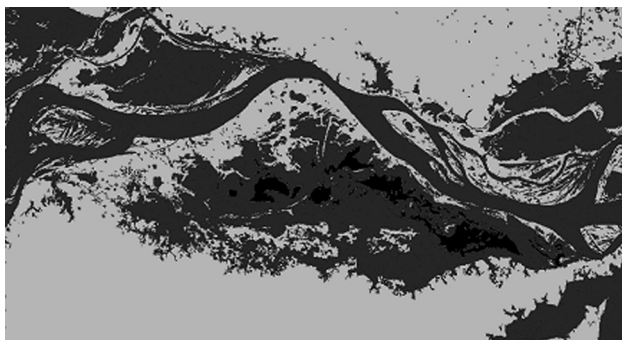
Figure 4 - Mapa de regiões adequadas (áreas mais escuras - pretas) para a instalação da plataforma de coleta de dados ambientais. Map of suitable regions (black areas) for installing the buoy moored telemetric system.