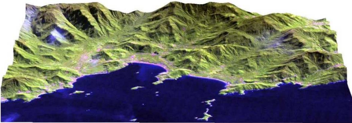
Fig. 2. Imagem da área de estudo em visão tridimensional, resultado de integração de imagem Landsat 7- ETM+ com modelo numérico de terreno SRTM-30 metros.