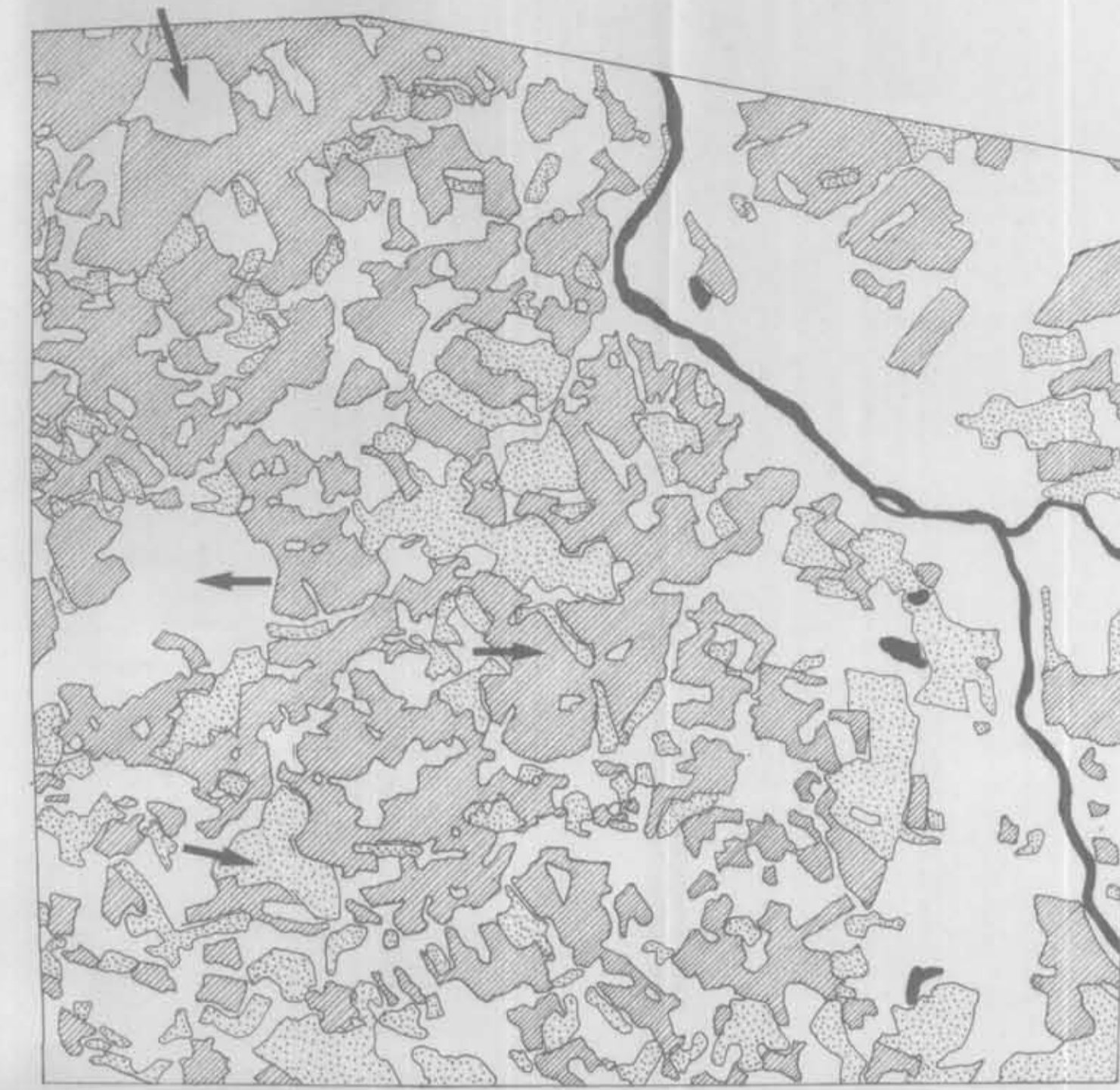
PASSAGEM DE 21/NOV/79