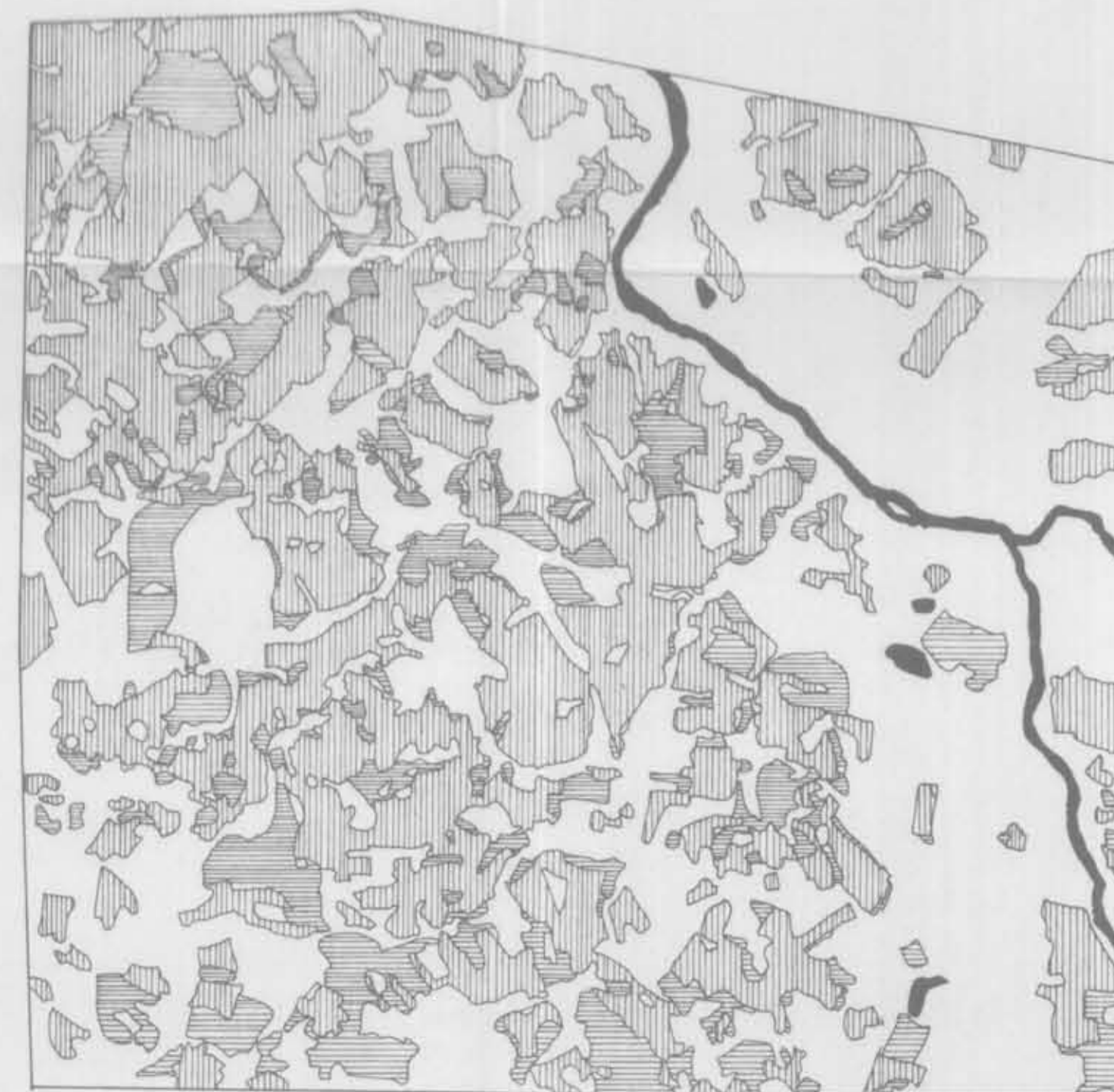
SOMATÓRIO DAS PASSAGENS DE SET. + NOV.