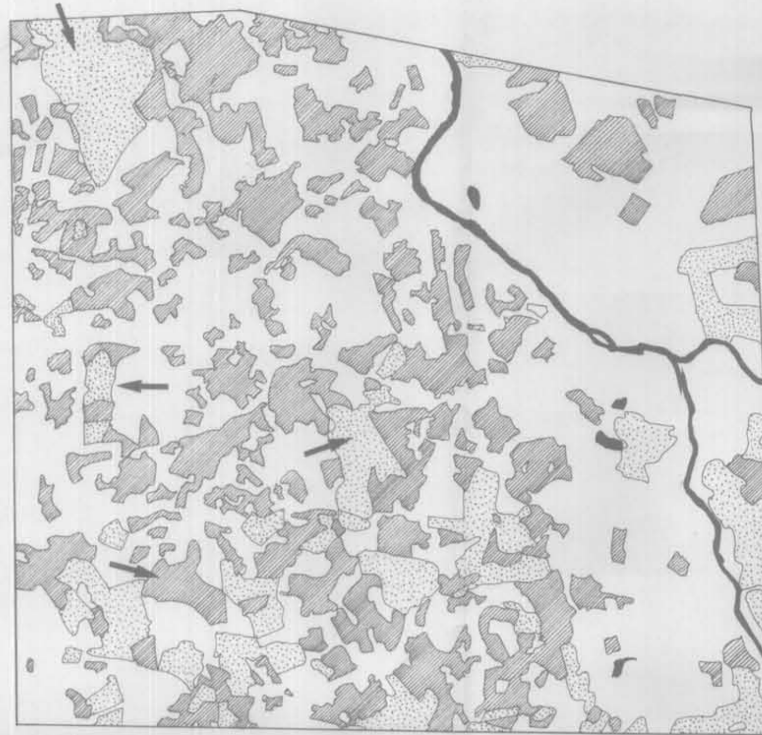
PASSAGEM DE 21/JUN/79