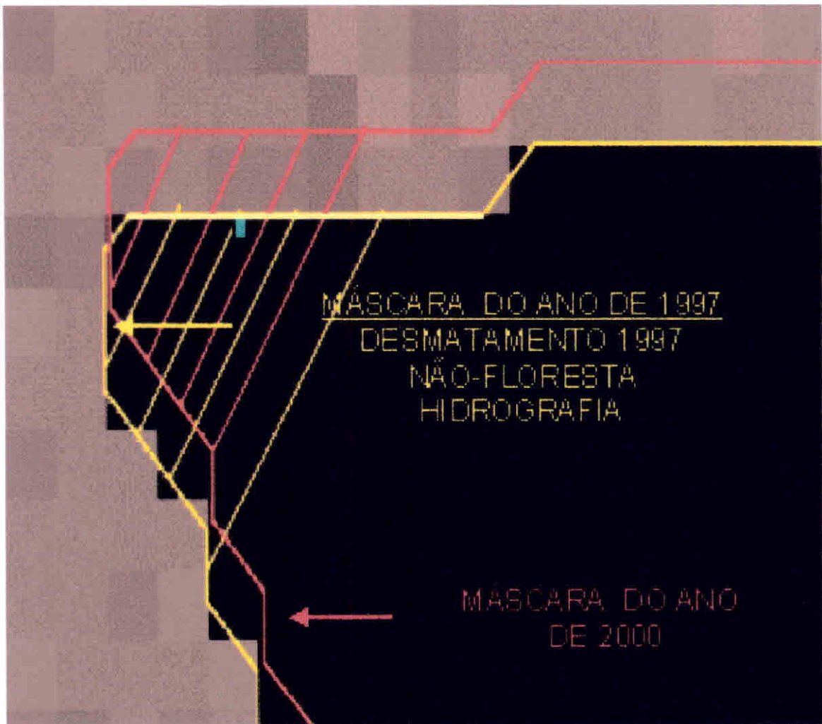
Fig.1 Imagem fração-sombra do ano de 2000 e as respectivas máscaras obtidas para os anos de 1997 (amarelo) e para o ano de 2000 (vermelho).

Foi feita a superposição e a comparação dos limites das máscaras dos anos de 1997 e de 2000 sobre a imagem sintética fração-sombra do ano de 2000 e analisou-se os tipos de distorções que ocorriam. Além da grande área de interseção entre as máscaras dos anos de 1997 e 2000 existem dois alinhamentos sistemáticos de “pixels”, representando uma área que está sendo incluída e outra que está sendo omitida. A Figura 2 mostra os dois tipos de alinhamentos de “pixels” existentes quando são comparadas as duas máscaras. A correção das distorções observadas entre os mapas dos anos de 1997 e 2000 foi baseada nestes pixels alinhados.