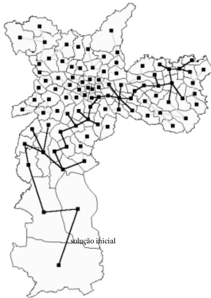
Figura 2: Soluções visitadas no processo de busca.