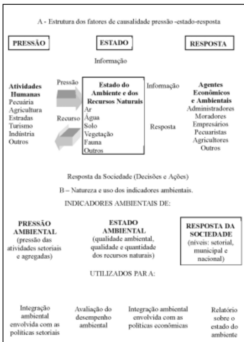
Figura 3 - Modelo conceitual sobre fatores causais e indicadores de Pressão-Estado-Resposta usados como base para estruturação das informações (Adaptado de OECD, 1993, p. 10)